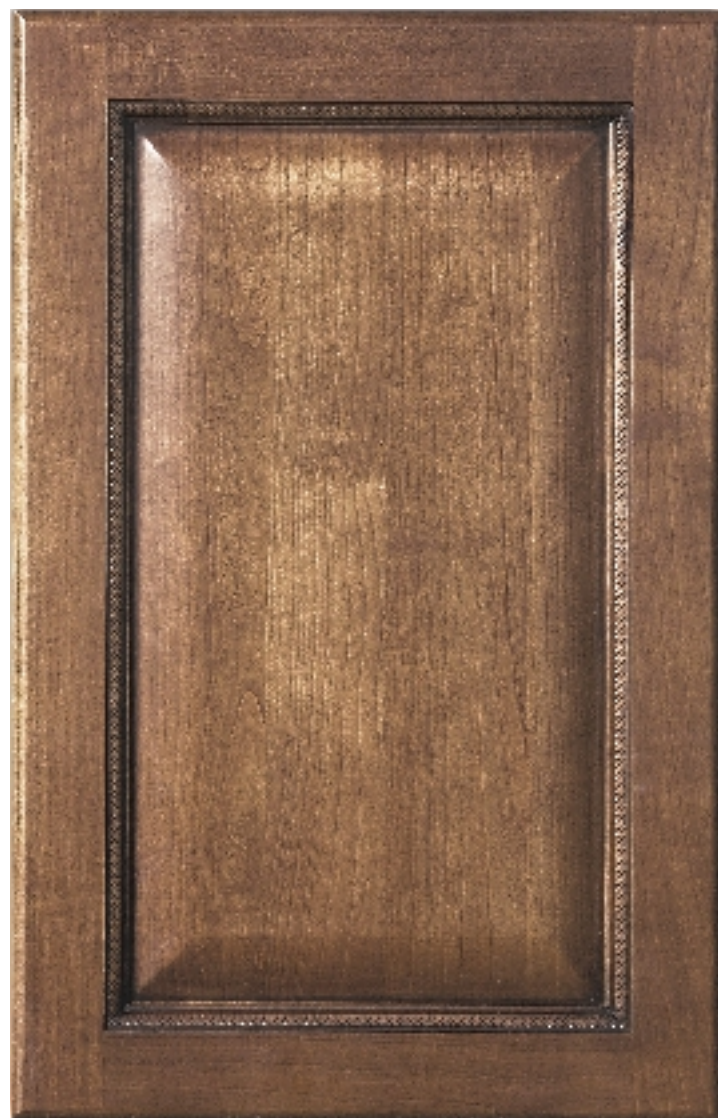
Фасад VIVALDI рамка массив вишни, филёнка МДФ, облицованная натуральным шпоном вишни.