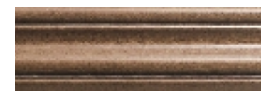
Карниз верхний прямой