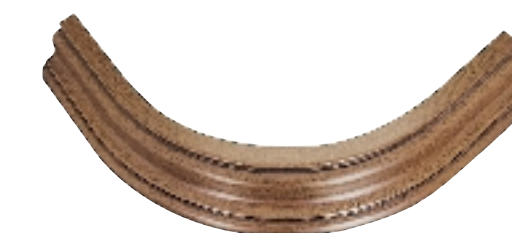
Карниз верхний закругленный