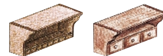
Полочки для специй

Цвет в полиграфическом исполнении требует обязательного сопоставления с оригиналом (из-за возможных отклонений при печати)