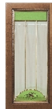
Фасад с витражным стеклом