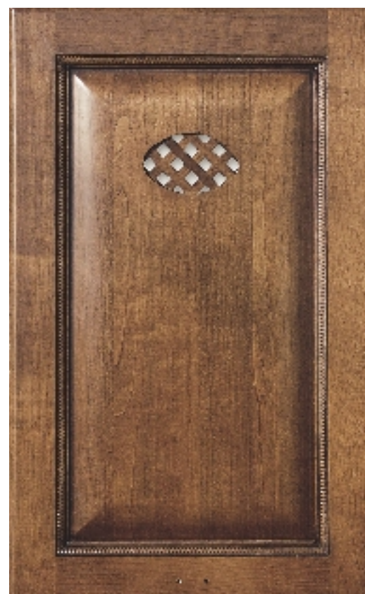
Фасад VIVALDI с декоративной решёткой 716 x 446 мм